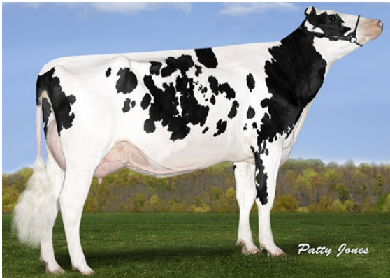
SILVERRIDGE V MUNITION EARWIG THIRD DAM